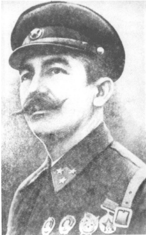
П.А. Белов, командир 1-го гвардейского кавалерийского корпуса, затем – командующий 61-ой армией.

Не встречая серьезного сопротивления, советские воины в течение нескольких суток освободили почти всю территорию района. Только в северной его части, где расположены деревни Черная Грязь, Воронино и другие, еще почти месяц шли тяжелые бои. Советские воины наносили удары по врагу в направлении на Юхнов. Здесь вместе с пехотинцами героически сражались конники 1-го гвардейского кавалерийского корпуса под командованием генерал-лей-